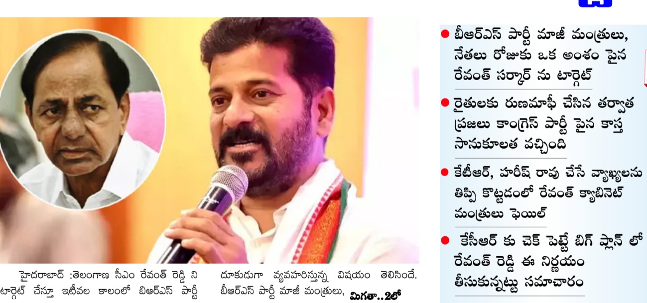
హైదరాబాద్ : తెలంగాణ సీఎం రేవంత్ రెడ్డి ని టార్గెట్ చేస్తూ ఇటీవల కాలంలో బిఆర్ఎస్ పార్టీ దూకుడుగా వ్యవహరిస్తున్న విషయం తెలిసిందే. బీఆర్ఎస్ పార్టీ మాజీ మంత్రులు, విగతా..2లో