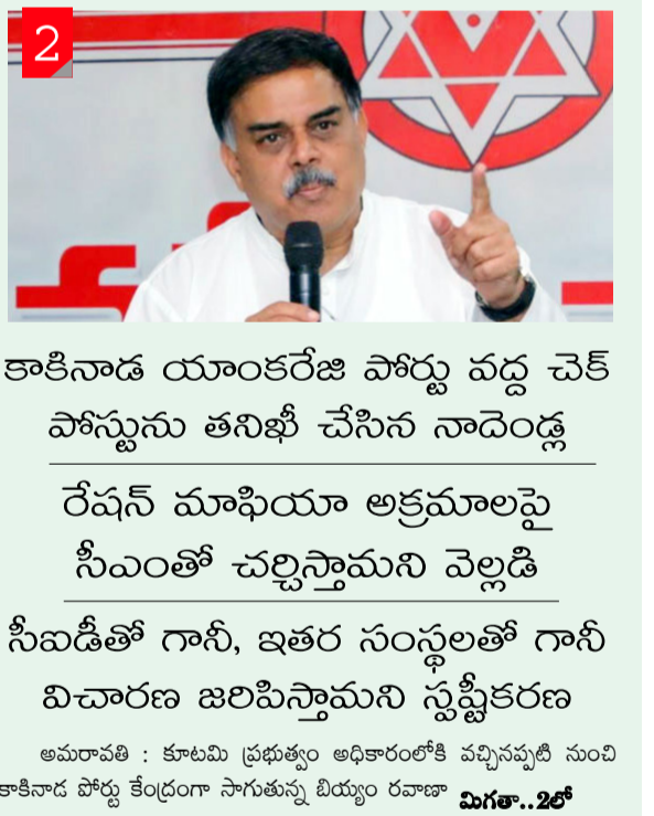
అమరావతి : కూటమి ప్రభుత్వం అధికారంలోకి వచ్చినప్పటి నుంచి కాకినాడ పోర్టు కేంద్రంగా సాగుతున్న దివ్యం రవాణా విగతా..2లో