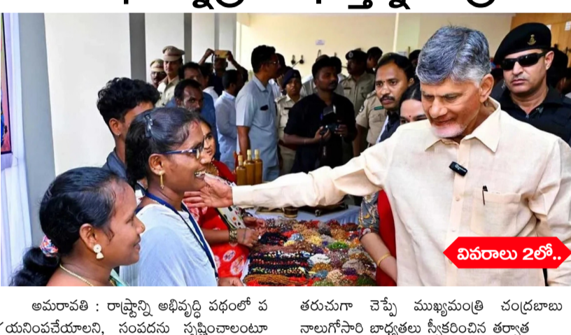
వివరాలు 2లో.. అమరావతి : రాష్ట్రాన్ని అభివృద్ధి పథంలో ప తరుచుగా చెప్పే ముఖ్యమంత్రి చంద్రబాబు యనివచేయాలని, సంపదను సృష్టించాలంటూ నాలుగోసారి బాద్శతలు స్వీకరించిన తర్వాత