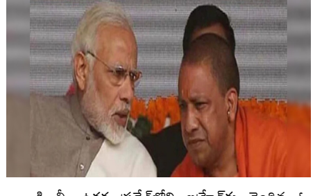
డి. ట్రి: ఉత్తర ప్రదేశ్ లోని బహుచక్రం చెందిన ఓ ముస్లిం మహిళ ప్రధాని నరేంద్ర మోదీని, ఉత్తర ప్రదేశ్