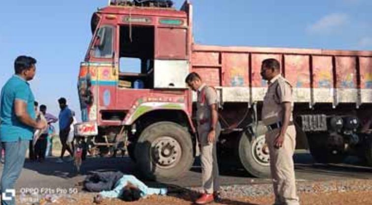
ప్రాంతానికి వెళ్లి వివరాలు సేకరించారు. వారు ఉన్నత అధికారులకు సమాచారం ఇవ్వగా ఒంగోలు నుండి క్లూస్ టీం, డాక్ స్వాగ్ట్ బృందాలు ఘటన ప్రాంతానికి వచ్చి వేరిముద్రలు సహకరించారు. డాక్ ఆ ప్రాంతాన్ని క్షుణ్ణంగా పరిశీలించింది. ఈ సందర్భంగా సర్కిల్ ఇన్స్పెక్టర్ మాట్లాడుతూ ఘటనపై విచారణ జరిపి కేసు సమయా చేస్తామని అన్నారు. పోస్టుమార్షం రిపోర్టులో ఫూర్తి వివరాలు తెలుస్తాయని ఆయన అన్నారు.