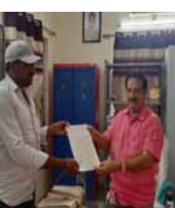
ప్రకాశం జిల్లా బ్యారో, (శుభోదయం న్యూస్):పరికుంటపాడు మండలం లోని తూర్పు లొంపిహొడ్ల తదితర గ్రామాల ప్రజలు పశు వుల ఆసుపత్రి మంజూరు కొరకు ఉదయగిరి శాసనసభ్యులు కాకర్ల సురేష్ దృష్టికి తీసుకువెళ్లారు. వెంటనే ఆయన స్పందిస్తూ సిఫార్సు లేఖతో ప్రతిపాదనలు సిద్ధం చేయమని జిల్లా పశు సంవర్ధకశాఖ అధికారి రమేష్ నాయక్ ను ఆదేశించారు. అందులో భాగంగా యువ నాయకులు రావేడ్ మండల తెలుగు యువత ప్రకారం కార్యదర్శి మారినేని రామకృష్ణ సోమవారం నాడు వెల్లూరులోని జిల్లా పశుసంవర్ధక శాఖ అధికారి రమేష్ నాయక్ కు ఎమ్మెల్యే కాకర్ల సురేష్ సిఫార్సు లేఖ తో కూడిన పత్రాన్ని అందజేశారు. ఈ