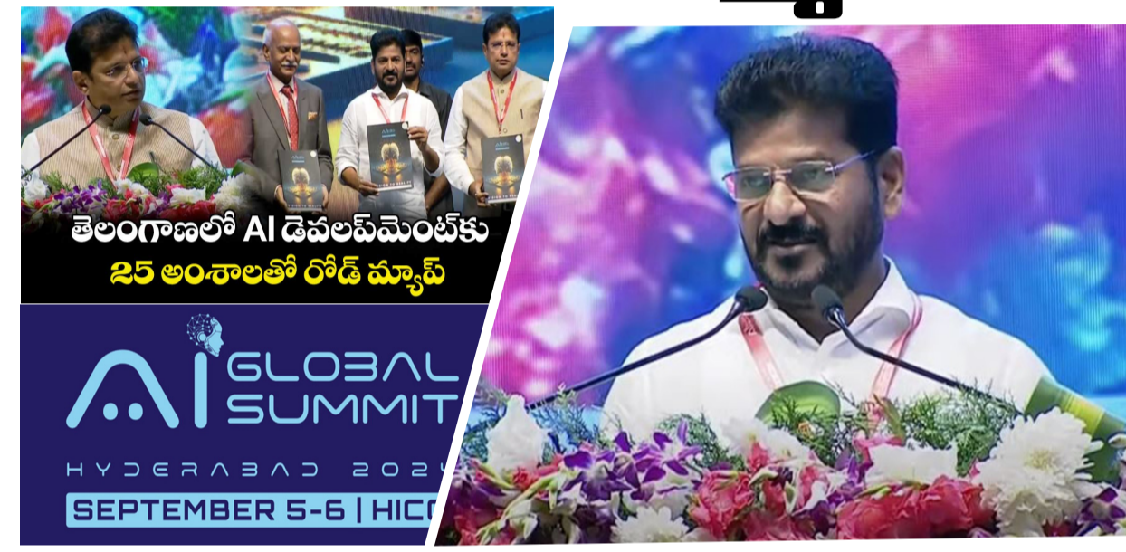
తెలంగాణలో AI డెవలప్ మెంట్ కు 25 అంశాలతో రోడ్ మ్యాప్ తెలిపారు. రైల్ ఇంజిన్, ఫోటో కెమెరా మొదలు కొని ఇప్పుడు ఎట కి వచ్చామన్నారు. క్రమంగా టెక్నాలజీ పెరుగుతోందన్నారు. ఎన్నికల ముందు డిక్టేషన్ లో చెప్పినట్లే ఎట కి మొదటి ప్రాధాన్యత ఇస్తున్నామని తెలిపారు. ఆర్టిఫిషియల్ ఇంటెలిజెన్స్ ఇతర పరిష్కారం కి చెందిన వారికి అవకాశాలు ఇవ్వడానికి సిద్ధంగా ఉన్నామన్నారు. తెలంగాణలో పెట్టుబడులు పెట్టడానికి అందరికీ అవకాశం ఇస్తున్నామని తెలిపారు. సాంకేతికత, అభివృద్ధిని లేకుండా సమాజంలో ఏ మార్పు జరగదన్నారు. మొదటి రైలు, ఇంజిన్ ఆవిష్కరణ తరువాత ప్రపంచం పూర్తిగా మారిందన్నారు. ఏగ్..2లో