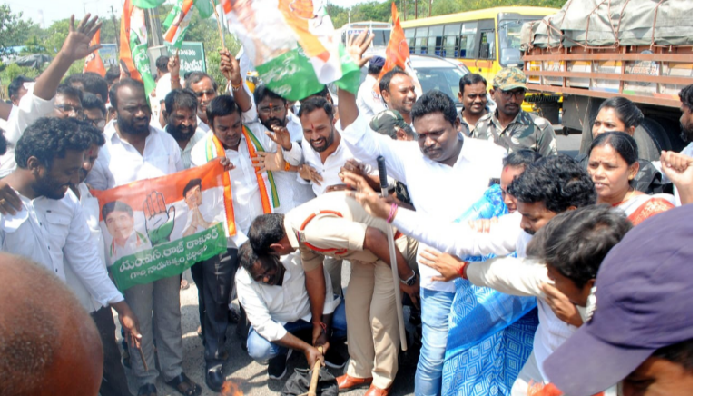
సమస్యలో గేయంగా పనిచేస్తూ జో డోయాత ద్వారా దేశమంత పర్యటించి ప్రజా సమస్యల పరిష్కారానికి కృషి చేస్తున్న రాహుల్ గాంధీ, గారి పైన చేసినటువంటి వ్యాఖ్యలను తీవ్రంగా ఖండించారు రాహుల్ గాంధీ, నిత్యం ప్రజల్లో ఉంటూ సమస్యల పరిష్కారానికి కృషి చేస్తూ అన్ని పార్టీల మన్ననలు పొందుతున్నారా అలాంటి నాయకుని పై ఇష్టం వచ్చినట్లు మాట్లాడితే కాంగ్రెస్ పార్టీ కార్యకర్తలు కోరుకునే ప్రసక్తి లేదని బిజెపి నాయకుల ఆసీనులను ముట్టడిస్తామని అని హెచ్చరించడం జరిగింది. ప్రతిపక్ష నేతగా 10 సంవత్సరాల నుండి బదుగు బలహీన వర్గాల అభివృద్ధి ధ్యేయంగా పనిచేస్తూ ప్రభుత్వాల దృష్టికి అధికారాల దృష్టికి తీసుకు వెళ్తూ సమస్యల పరిష్కారానికి కృషి చేస్తున్నారా రాహుల్ గాంధీ రోజుల్లో కాంగ్రెస్ పార్టీని అధికారంలోకి తీసుకురావాలని ప్రతి ఒక్క కార్యకర్త సైనికుడు వలె పనిచేసి రాహుల్ గాంధీ గారిని ప్రధానమంత్రిని చేయాలని పిలుపునిచ్చడం జరిగింది అంతేకాకుండా తీవ్ర వ్యాఖ్యలు చేసినటువంటి వారిపైన చర్యలు తీసుకోవాలని దీనికి బాధ్యత వహిస్తూ హెచ్చరికలు మంత్రి అమిత్ షా రాజీనామా చేయాలని తెలియజేయడం జరిగింది ఈ కార్యక్రమంలో కాల్య లింగస్వామి, రవికుమార్, పాత పిల్లి ఎల్లయ్య, మార్కెట్ రాజిరెడ్డి, డి.బి.బాలరాజు, బొమ్మక రాజేష్, పెద్దెల్లి ప్రకాష్ కొప్పుల శంకర్, నాయని ఓదెలు, గట్ల రమేష్, దాసరి సాంబమూర్తి, యాకూట్, దాసరి విజయ్, బాల రాజ్ కుమార్, కొత్తమ్ సతీష్, శ్రీనివాస్ రెడ్డి, ఉదయరాజ్, అడైవ రవి, మాలెం మధు, హనుమ సత్యనారాయణ, గుండేటి శంకర్, తిరుపతి రెడ్డి, గుమ్మడి రవి, గడ్డం శేఖర్, కంకణాల రాజు, సాయి, బొంతుల లచ్చన్న మోహన్ సన్ని, ఉల్లంపిల రమేష్, బాబు మియా, గడ్డం శేషు, సతీష్ గౌడ్, వరలక్ష్మి, శాంత కుమారి, పద్మ, అల్లి శంకర్, తిరుపతి రెడ్డి, గోవర్ధన్ శాస్త్రి, కుంట నది, దామక పవన్, ప్రసాద్, సుంకర్ సంతోష్, గుప్తా, అధిక సంఖ్యలో కాంగ్రెస్ నాయకులు పాల్గొన్నారు.