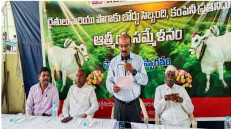
టంగుటూరు (శుభోదయం స్టూన్) : పాగాకు కొనుగోళ్ల ముగింపు కార్యక్రమంలో భాగంగా టంగుటూరు పాగాకు బోర్డు ఏపీఎస్ నంబర్ - 24 అవరణంలో రైతుల - కంపెనీ ప్రతినిధుల - పాగాకు