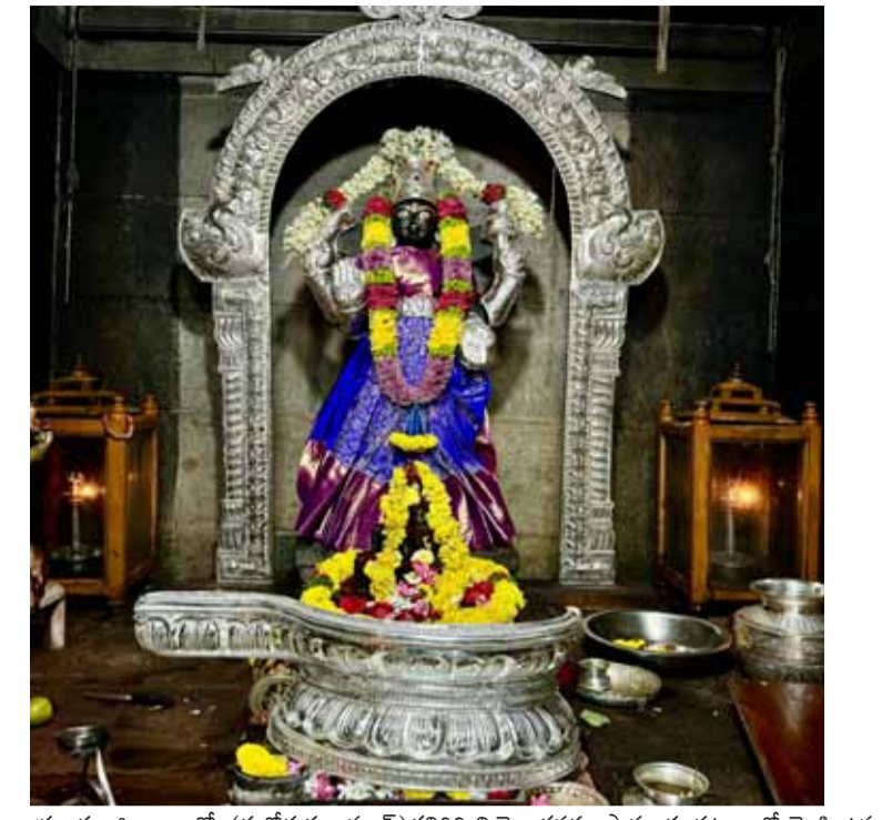
ప్రకాశం జిల్లా బ్యారో, (శుభోదయం స్టూన్) కనిగిరి నియోజకవర్గం పామూరు పట్టణంలో వెలసి ఉన్న ఆర్యవైశ్యుల కులదేవత శ్రీ వాసవి కన్యకాపరమేశ్వరి ఆలయ ప్రాంగణంలో ఉన్న నగరేశ్వర స్వామికి (ఆత్మీయం) దసరా నవరాత్రుల వేడుకల సందర్భంగా పానిమట్టం (సుమారు మూడు కేజీల వెండి)