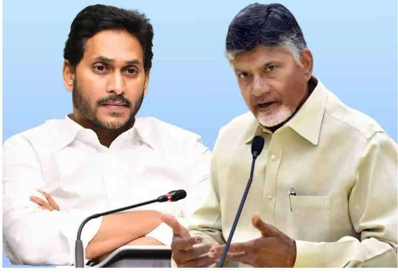
ఎన్ఐఆర్ సెన్సెయివల 25వ రిజిస్టర్ చేస్తే.. అంతకు ముందే సెన్సెయివల 18వ ముఖ్యమంత్రిగా ఉన్న వ్యక్తి స్టేట్మెంట్ ఇచ్చాడు. సీట్ ఏర్పాటులో సెన్సెయివల 26వ అయితే.. అంతకన్నా ముందే ఎలా ప్రకటన ఇచ్చాడంటూ.. సీఎం బహిరంగ ప్రకటన కోట్ల మంది భక్తుల మనోభావాలను దెబ్బ తీస్తుందని కోర్టు చెప్పింది. ఇన్ని రకాలుగా చంద్రబాబును సుప్రీంకోర్టు అక్షేపించింది. అయితే మళ్లీ

పవీ వాలంటీర్ల కొనసాగింపుపై సందర్భం కొనసాగుతున్న నేపథ్యంలో.. బీడీపీ కూటమి ప్రభుత్వం మరో కీలక నిర్ణయం తీసుకుంది. పేవర్ల కొనుగోలు కోసం వాలంటీర్లకు ప్రతి నెలా ఇస్తే రూ.2000 భత్యం నిలిపివేయనున్నట్లు తెలిసింది. ఈ మేరకు ముఖ్యమంత్రి చంద్రబాబు నాయుడు నిర్ణయం తీసుకున్నట్లు సమాచారం. వైసీపీ ప్రభుత్వ హయాంలో ప్రభుత్వ కార్యక్రమాలపై అవగాహన పెంచుకునేందుకు, ప్రజలకు వివరించేందుకు ఉపయోగపడుతుందనే ఉద్దేశంతో వాలంటీర్లకు పేవర్ల భత్యం అందించేవారు. సర్దుబాటు ఎక్కువగా ఉన్న పేవర్ల కొనుగోలు చేసేందుకు గానూ ప్రతి నెలా రూ.200 భత్యాన్ని 2.60 లక్షల మంది వాలంటీర్లకు చెల్లిస్తూ వచ్చారు. అయితే బీడీపీ కూటమి ప్రభుత్వం ఈ రూ.200 భత్యాన్ని నిలిపివేయనున్నట్లు సమాచారం.