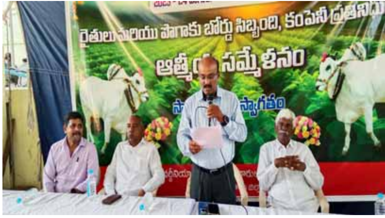
టంగుటూరు (శుభోదయం స్టూన్) : పాగాకు కొనుగోళ్ల ముగింపు కార్యక్రమంలో భాగంగా టంగుటూరు పాగాకు బోర్డు ఏపీఎస్ నంబర్ - 24 అవరణంలో రైతుల - కంపెనీ ప్రతినిధుల - పాగాకు