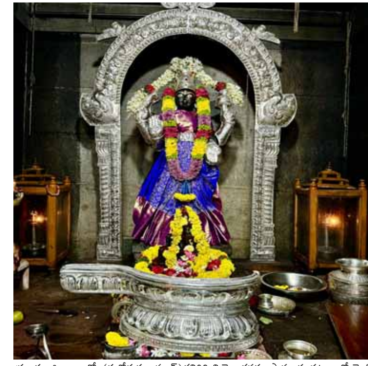
ప్రకాశం జిల్లా బ్యారో, (శుభోదయం స్టూన్) కనిగిరి నియోజకవర్గం పామూరు పట్టణంలో వెలసి ఉన్న ఆర్యవైశ్యుల కులదేవత శ్రీ వాసవి కన్యకా పరమేశ్వరి ఆలయ ప్రాంగణంలో ఉన్న నగరేశ్వర స్వామికి (ఆత్మీయం) దసరా నవరాత్రుల వేడుకల సందర్భంగా పానిమట్టం (సుమారు మూడు కేజీల వెండి)