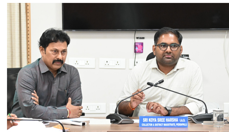
పెద్దపల్లి జిల్లా ప్రతినిధి, (శుభోదయం న్యూస్): సోమవారం జిల్లా కలెక్టర్ కోయ శ్రీ హర్ష నమీకృత జిల్లా కలెక్టరేట్ లో ధరణి దరఖాస్తులు, ఎల్.ఆర్.ఎస్ వంటి పలు అంశాల పై ఆదనపు కలెక్టర్ శ్యామ ప్రసాద్