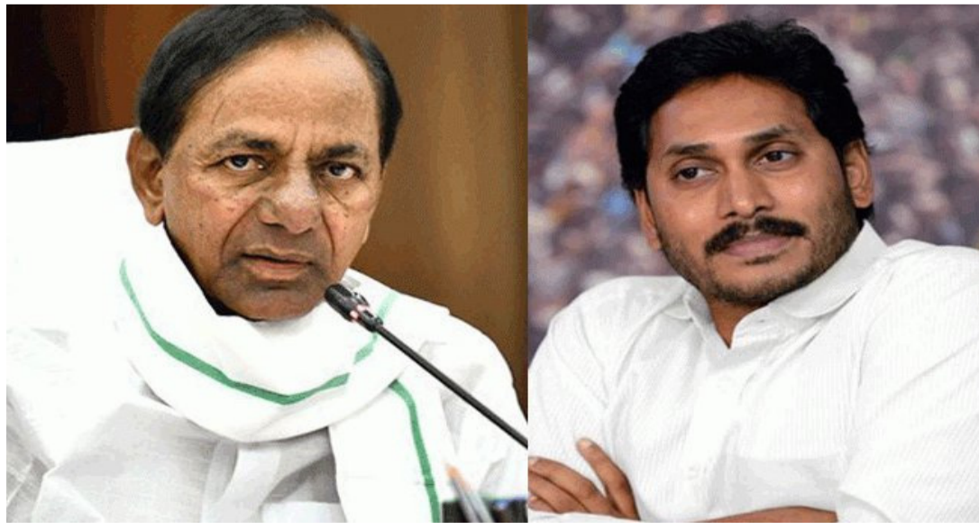
రెండు తెలుగు రాష్ట్ర రాజకీయాల్లోనూ ఇప్పుడు ఓ కామన్ విషయం సృష్టంగా కనిపిస్తోంది. ఇందులో భాగంగా... రెండు తెలుగు రాష్ట్రాల్లోనూ ప్రతిపక్ష నేతలు ప్రజాసమస్యలపై చర్చించేందుకు అసెంబ్లీకి హాజరయ్యారంటే... మిగతా..2లో