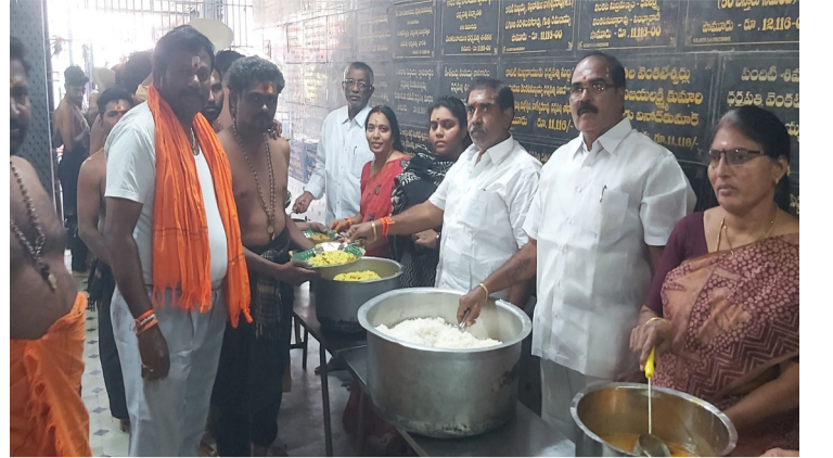
ప్రకాశం జిల్లా బ్యారో - చంద్ర (శుభోదయం న్యూస్): కనిగిరి నియోజకవర్గం పామరూ పట్టణంలోని అయ్యప్ప స్వామి ఆలయంలో మూడారలూడ అన్న ప్రసాద వితరణ చేసిన పామరూ మాజీ చైన్ ఎంపీపీ