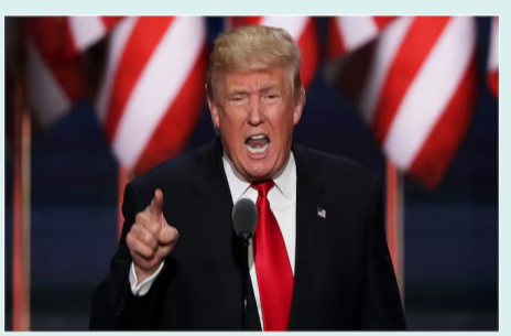
వాషింగ్టన్: అమెరికా అధ్యక్ష పదవిని చేపట్టాల్తున్న డొనాల్డ్ ట్రంప్ హెచ్చరికల వర్షం కొనసాగుతున్నది. పన్నులు తగ్గించాలని ఇటీవల భారతీయ హెచ్చరించిన విగత 2లో

లేదంటే పన్నుల కొరడా ఝుళిపిస్తా ఈయూకు డొనాల్డ్ ట్రంప్ హెచ్చరిక