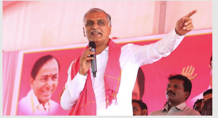
హైదరాబాద్: బీఆర్ఎస్ పార్టీ అధికారంలో ఉన్న పదేళ్లలో రూ. 6.40 లక్షల కోట్ల అప్పులు చేశారని ఇవాళ అసెంబ్లీలో సీఎం రేవంత్ రెడ్డి అరోపించడం తెలిసిందే. అప్పులు చేసి కూడా ఇంకా సిగ్గులేకుండా మాట్లాడుతున్నారని... కాంగ్రెస్ ప్రభుత్వం రూ. 1.27 లక్షల కోట్ల అప్పు చేసినదని అంటున్నారని రేవంత్ రెడ్డి మండిపడ్డారు. మీరు చేసిన అప్పుల వడ్డీలు కట్టడానికి మేం అప్పులు చేయాల్సి వస్తోందని బీఆర్ఎస్ పై ధ్వజమెత్తారు. ఈ నేపథ్యంలో, మాజీ మంత్రి, బీఆర్ఎస్ ఎమ్మెల్యే హాచీరావు మీడియాతో మాట్లాడుతూ రేవంత్ రెడ్డిపై విమర్శనాస్త్రాలు సంధించారు. అబద్ధాలు చెప్పడంలో ముఖ్యమంత్రి గోపెల్స్ ను మించిపోయాడని అన్నారు. విగత 2లో

మరి నీ తమ్ముడిని ఎందుకు అరెస్టు చేయలేదు.. సీఎం రేవంత్ రెడ్డిని నిలదీసిన హాచీరావు రుణమాఫీపై సీఎం రేవంత్తో చర్చకు సిద్ధం గత ప్రభుత్వం రూ. 6.40 లక్షల కోట్లు అప్పు చేసినదన్న రేవంత్ రెడ్డి సీఎం గోపెల్స్ ను మించిపోయాడన్న హాచీరావు