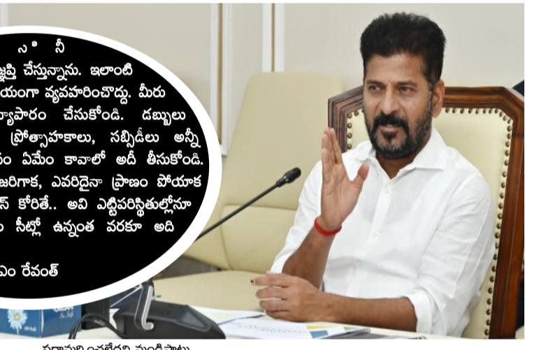
పరామర్శించలేదని మండిపాటు తొక్కినట్లు ఘటనకు ప్రత్యేకంగా పరోక్షంగా కారకులైన వారిని బిడ్డిపెట్టాల్సి మున్నె సీఎం హైదరాబాద్: సీఎం వాళ్లకు మానవత్వం లేకపోవడాన్ని ఏమనాలని ముఖ్యమంత్రి రేవంత్ రెడ్డి ప్రశ్నించారు. సీఎం పరిశ్రమ తీరు అమానవీయమని.. ఎవరి ప్రాణాల్ని పోయిన తర్వాత ప్రత్యేక హక్కు కావాలంటే దొరకడని పేర్కొన్నారు. కేవలం ఒక్కరోజు పోలీస్ స్టేషన్ కు వెళ్లిన హీరోను పరామర్శించిన సీఎం పరిశ్రమ పెద్దలు... బాధిత కుటుంబీకులను కనీసం పరామర్శించలేదని మండిపడ్డారు. సాధారణ ప్రజల ప్రాణాలు కాపాడటం తమకు ప్రధానమని.. ప్రాణాలు పోయేందుకు ఎవరు కారణమైనా విడిచిపెట్టబోమని హెచ్చరించారు. సంధ్య ధీమేటర్ తొక్కినట్లు ఘటనకు ప్రత్యేకంగా పరోక్షంగా కారణమైన వారిని వివరించిన విగత 2లో

పార్టీ స్టేడియంలో తీర్మానం చేయడం సీఎం రేవంత్ నినిమా వాళ్లు స్వేచ్ఛా? సీఎం రేవంత్ వారిని ప్రత్యేకంగా పరిగణించే వట్టిలేమి లేదు.. అసెంబ్లీలో సీఎం రేవంత్ వ్యాఖ్యలు ఫోటోలు అనుమతి నిరాకరించారు. అల్లు అద్వైత్ రోడ్ షో చేశారు తొక్కినట్లు అరిగి ఒకరు చనిపోయినా.. అభిమానులకు చేతులు ఊపాటూ వెళ్లారు అరెస్టు కోసం వెళ్లిన ఫోటోలుతోనూ దురుసుగా ప్రవర్తించారు తల్లి చనిపోయి కొడుకు బ్రెయిన్ డెడ్ అయినా బాధిత కుటుంబాన్ని పరామర్శించలేదు మానవత్వం లేకుండా వ్యవహరించిన వారిని ఎదుర్కొంటా.. సీఎం పరిశ్రమను ప్రోత్సహిస్తాం.. కానీ ప్రాణాలు పోతుంటే ఊరకేవాలా? అల్లు అద్వైత్ కు ఏమైనా కాలాపోయిందా. కన్ను పోయిందా?.. ఒక్కరోజు జైలుకెళ్లేనే అంత మంది పరామర్శించారు చావుపతుకుల్లో ఉన్న బిల్డెడిని ఎవరూ