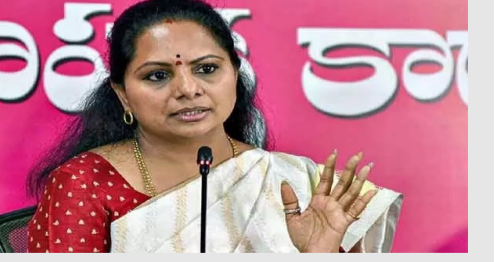
గ్రామాల్లో ఇప్పటికీ కూడా కుల వివక్ష, అంటరానితనం , రెండు గ్రామాల పద్ధతి ఇంకా కొనసాగుతోందని, గుళ్లు, దేవాలయాల్లోకి దళితులను రానివ్వడం లేదని విగత 2లో

గ్రామాల్లో ఇప్పటికీ కూడా కుల వివక్ష, అంటరానితనం , రెండు గ్రామాల పద్ధతి ఇంకా కొనసాగుతోందని, గుళ్లు, దేవాలయాల్లోకి దళితులను రానివ్వడం లేదని బీఆర్ఎస్? ఎంఎల్ఏ? సీ కల్యాణం కవిత శాసన మండలి దృష్టికి తీసుకుని వచ్చారు. విధాన మండలి ప్రారంభం కాగానే స్పెషల్ సెక్షన్ అంశాన్ని శాసన మండలి వైట్స్ గుర్తు సుఖేందర్ రెడ్డి అనుమతించగా.. ఎమ్మెల్యే కవిత ఈ అంశాన్ని సభ ముందు ఉంచారు. గ్రామాల్లో ఇప్పటికీ కూడా కుల వివక్ష, అంటరానితనం , రెండు గ్రామాల పద్ధతి ఇంకా కొనసాగుతోందని, గుళ్లు, దేవాలయాల్లోకి దళితులను రానివ్వడం లేదని విగత 2లో