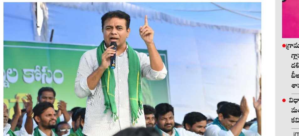
హైదరాబాద్: రైతుబంధు విషయంలో సీఎం రేవంత్ చెప్పినవన్నీ అబద్ధాలేనని బీఆర్ఎస్ వర్సెస్ ప్రెసిడెంట్ కేటీఆర్ స్పష్టం చేశారు. ఆయన ఓటుకు నోటు కేసులో విగత 2లో