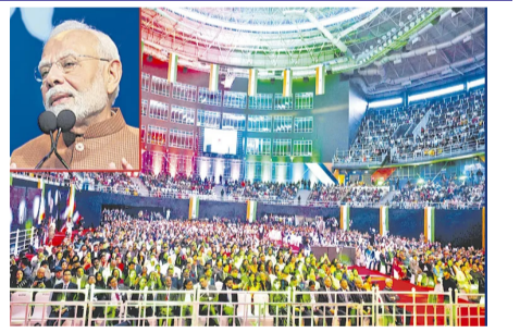
కువైట్ సీటీ: రెండు రోజుల పర్యటన నిమిత్తం భారత ప్రధానమంత్రి నరేంద్ర మోదీ గల్ఫ్ దేశమైన కువైట్ కు చేరుకున్నారు. విగత 2లో

ప్రధాని నరేంద్ర మోదీ కువైట్ పర్యటన ప్రారంభం కువైట్ రాజు షేక్ మోషల్ అల్ అహ్మద్ అల్ ఇబేద్ అల్ సబా ఆహ్వానం మేరకు ఆయన కువైట్ లో అడుగుపెట్టారు. ద్వైపాక్షిక చర్చలు కీలక రంగాల్లో బంధం అవకాశం 43 ఏళ్ల తర్వాత కువైట్ లో కాలమోపిన భారత ప్రధాని కువైట్ సీటీ: రెండు రోజుల పర్యటన నిమిత్తం భారత ప్రధానమంత్రి నరేంద్ర మోదీ గల్ఫ్ దేశమైన కువైట్ కు చేరుకున్నారు. విగత 2లో